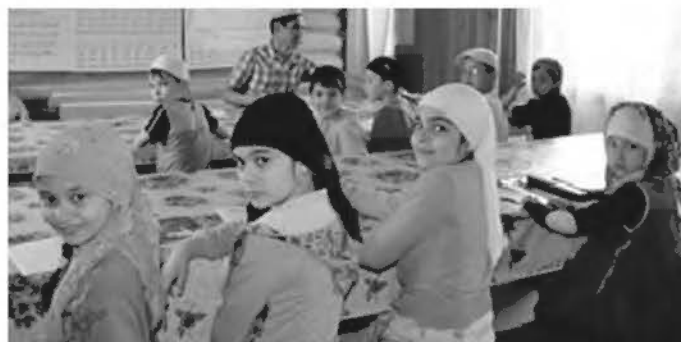
но в природу» в областном краеведческом музее. Для малышей будет также организованы различные игры и викторины.

За время сезона юные мусульмане посетят местные музеи и достопримечательные места города. Как показали детские лагеря предыдущих лет, детям особенно нравится посещение выставки «ок-