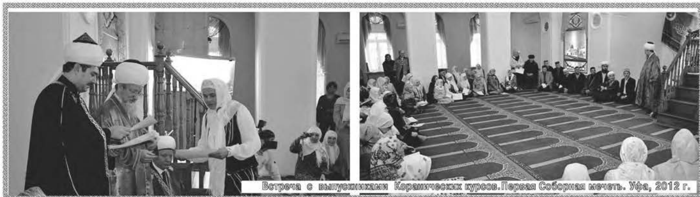
Встреча с выпускниками Коранических курсов. Первая Соборная мечеть. Уфа, 2012 г.