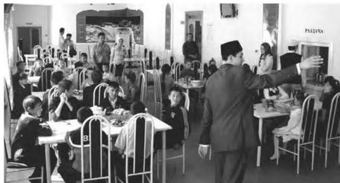
исламский университет (ЦДУМ России). Там их ждала экскурсия по университету и аздничный обед.