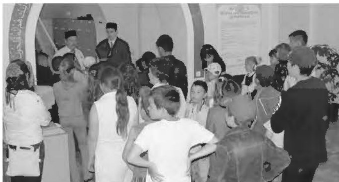
Воспитанники детских домов РБ посетили кукольный театр в Уфе, после чего были приглашены в Российский